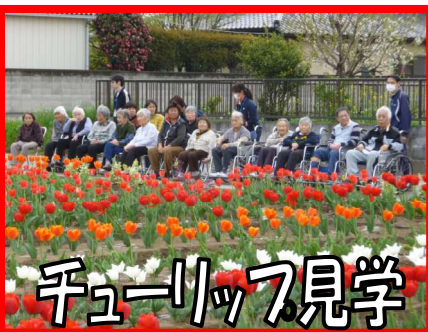
チューリップ見学