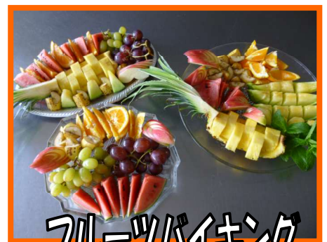
フルーツバイキング