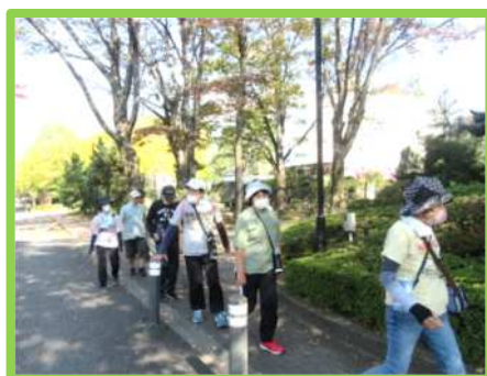
👣 散歩 👣 (健康維持のため毎日行っています!)