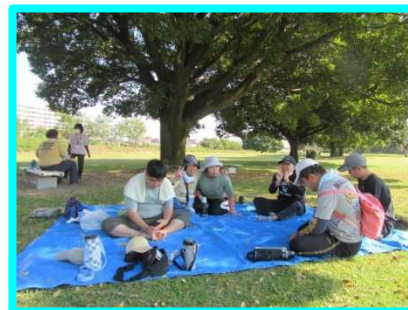
🎵 温かい日には、公園 でおにぎりを食べ ました🍙