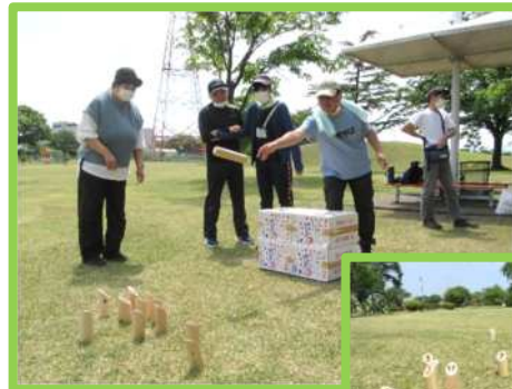
★健康増進活動★ (モルック・グラウンドゴルフなど)