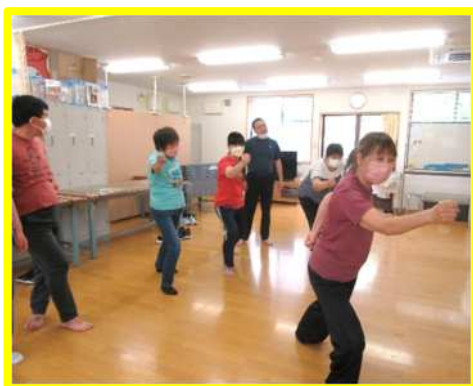
👐 気功教室 👐 (次回は1月の予定です。)