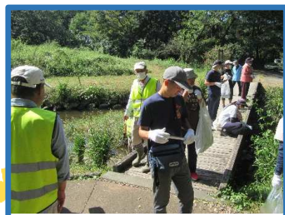
「水辺の森クリーン作戦」実施中!