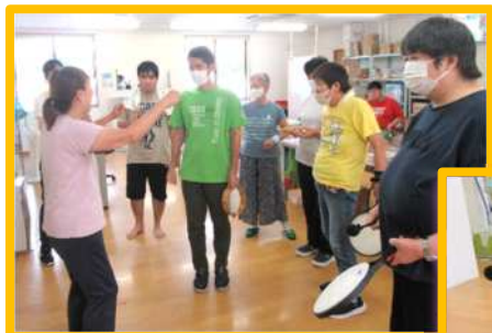
♪ 合奏しよう会 ♪ (次回は2月の予定です。)