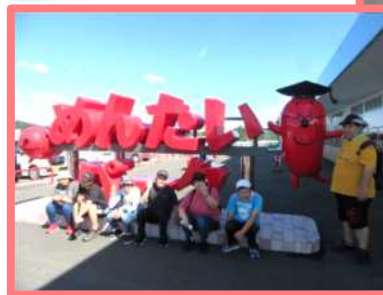
🏠 体験行事 🏠 「めんたいパーク」や 「下久保ダム」を見学 しました。